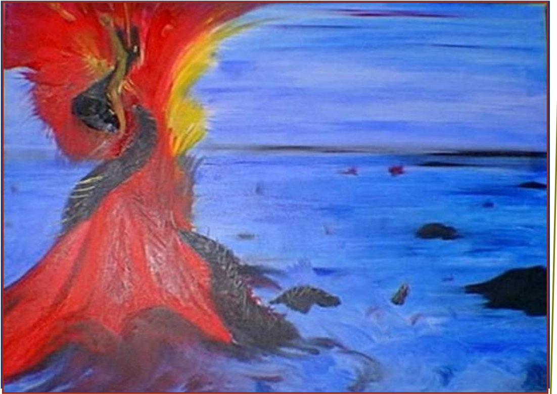
© Eugenia Dietrich. "El rapto de la luna."