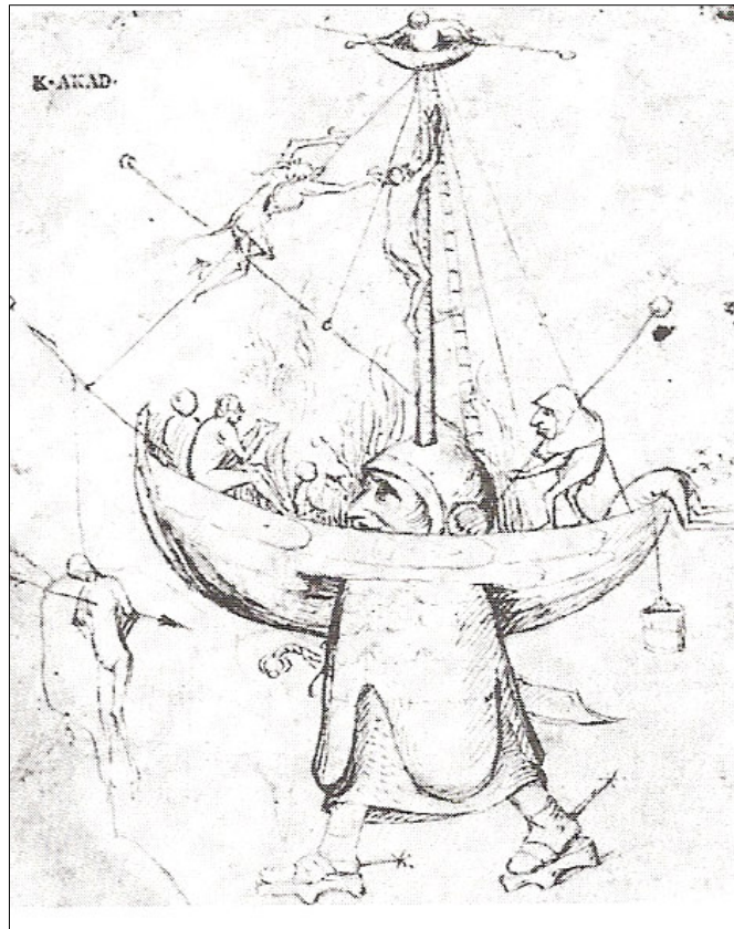
El Bosco. La nave de los locos en llamas

Todas las actividades académicas se llevarán a cabo en el edificio Southham Hall (SA)